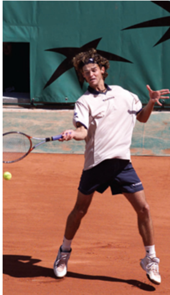
Forehand square e open stance

O quadril é uma articulação com grande estabilidade e que recebe uma carga muito grande. A sua anatomia possibilita a mecânica ideal para proporcionar os movimentos dos membros inferiores e para sustentar o peso do corpo. Quando há alguma variação anatômica (mesmo que pequena) nesta precisa arquitetura, pode haver um comprometimento da função do quadril. Uma nova perspectiva em relação ao quadril já está criada. Até então, dor nesta região no esportista resumia-se grosseiramente a estiramentos musculares, tendinites e a outras