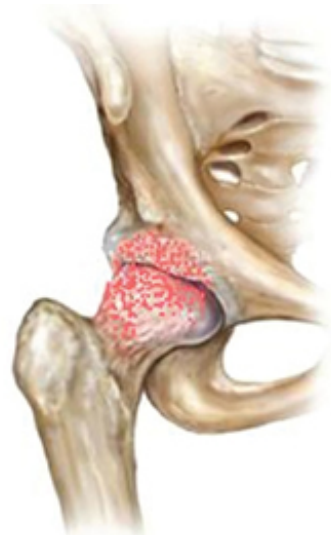
Articulação do quadril com degeneração da cartilagem

O quadril é uma articulação com grande estabilidade e que recebe uma carga muito grande. A sua anatomia possibilita a mecânica ideal para proporcionar os movimentos dos membros inferiores e para sustentar o peso do corpo. Quando há alguma variação anatômica (mesmo que pequena) nesta precisa arquitetura, pode haver um comprometimento da função do quadril. Uma nova perspectiva em relação ao quadril já está criada. Até então, dor nesta região no esportista resumia-se grosseiramente a estiramentos musculares, tendinites e a outras